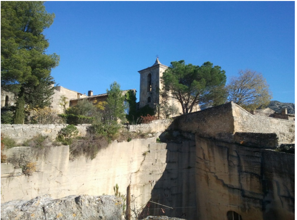
Carrière des Taillades

Passionné de culture provençale, de patrimoine et d'environnement, il a organisé une quinzaine d'expositions différentes sur des sujets variés.